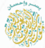
مؤسسة عبداللطيف العيسى الخيرية