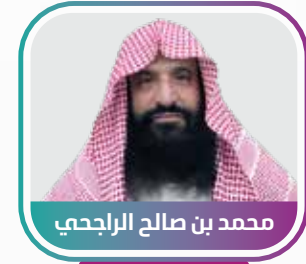
محمد بن صالح الراجحي