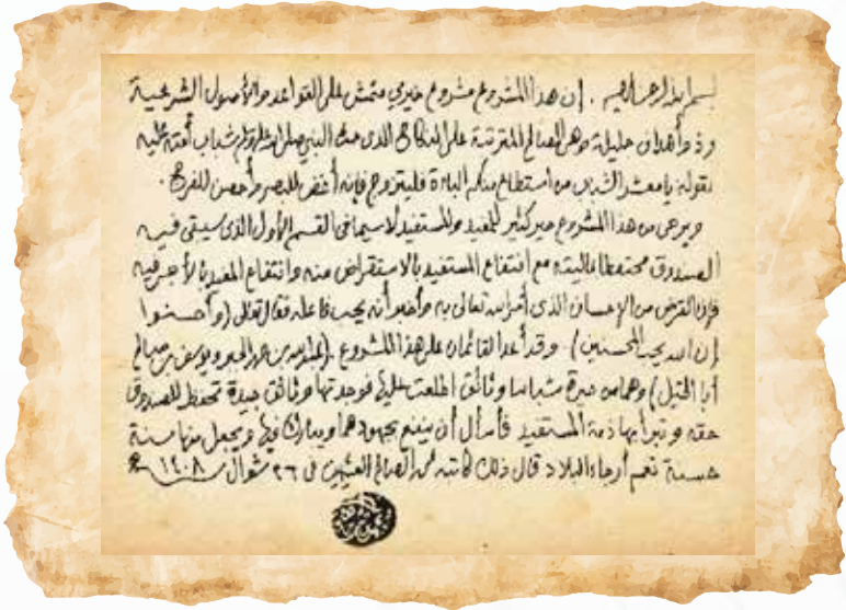
تزكية عضو هيئة كبار العلماء فضيلة الشيخ :