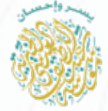
مؤسسة عبداللطيف العيسى الخيرية